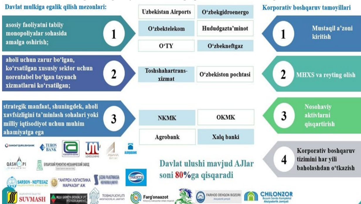
2-rasm. Davlat mulkiga egalik qilish mezonlari va korporativ boshqaruv bo'yicha talablarning qonun darajasida belgilanishi

Bundan tashqari, Rahbarlik tamoyillariga muvofiq davlat xabardor va faol mulkdor sifatida harakat qilishi, shu orqali davlat korxonalarining shaffof va hisobdorligi hamda yuqori darajadagi professionallik va samaradorlik bilan boshqarilishini ta'minlashi kerakligi belgilangan bo'lib, dissertatsiyada mazkur tavsiyani amalga oshirish maqsadida davlat ulushi mavjud aksiyadorlik jamiyatlarining kuzatuv kengashi va aksiyadorlar umumiy yig'ilishi bayonlarini Davlat aktivlarini boshqarish agentligi axborot tizimiga joylashtirish talabini kiritish va mazkur axborot tizimiga aksiyador vazifasini amalga oshiruvchi davlat organlariga foydalanish huquqini berish taklif etilgan.